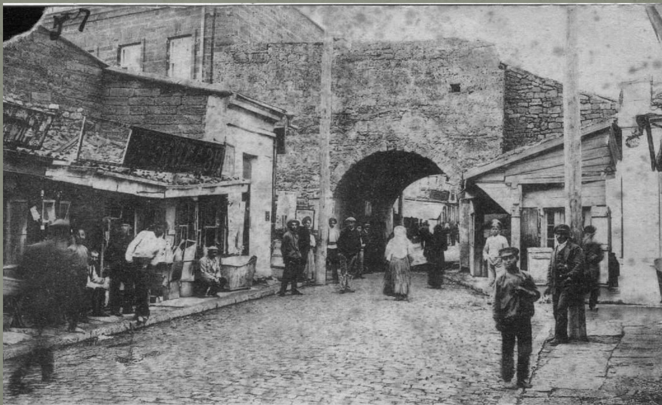
№ 16. Евпаторія. Древняя крепостная ворота. Eupatoria. Ancienne porte de forteresse.

Гезлёв ничем не отличался от большинства средневековых городов. Он был разделен на две части - торгово-ремесленную и жилую. Возле Восточных ворот располагались купеческие лавки, постоялые дворы, кофейни, кузнечные, слесарные, обувные, шорные, лудильные, жестяные, столярные мастерские, изделия которых шли, в основном, на внешний рынок, в Турцию.